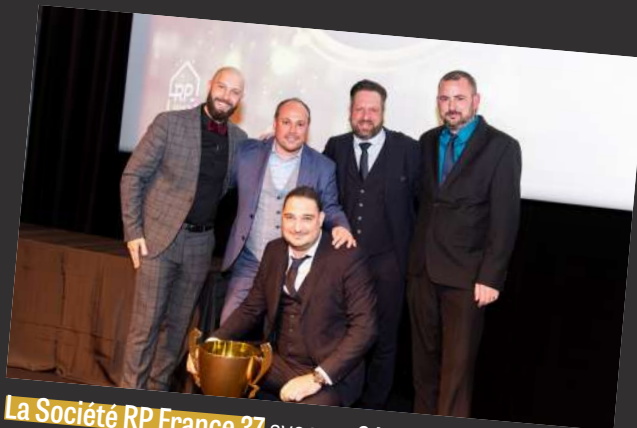
La Société RP France 37 avec un CA de 916 230€ et une moyenne de 72 976 points concours

récompense celle ayant réalisé la meilleure moyenne de points concours