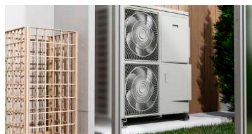
Nouveau produit La PAC AIR EAU