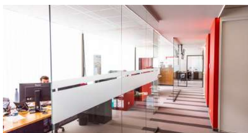
Zoom sur La Holding Rôle, organigramme, interview...