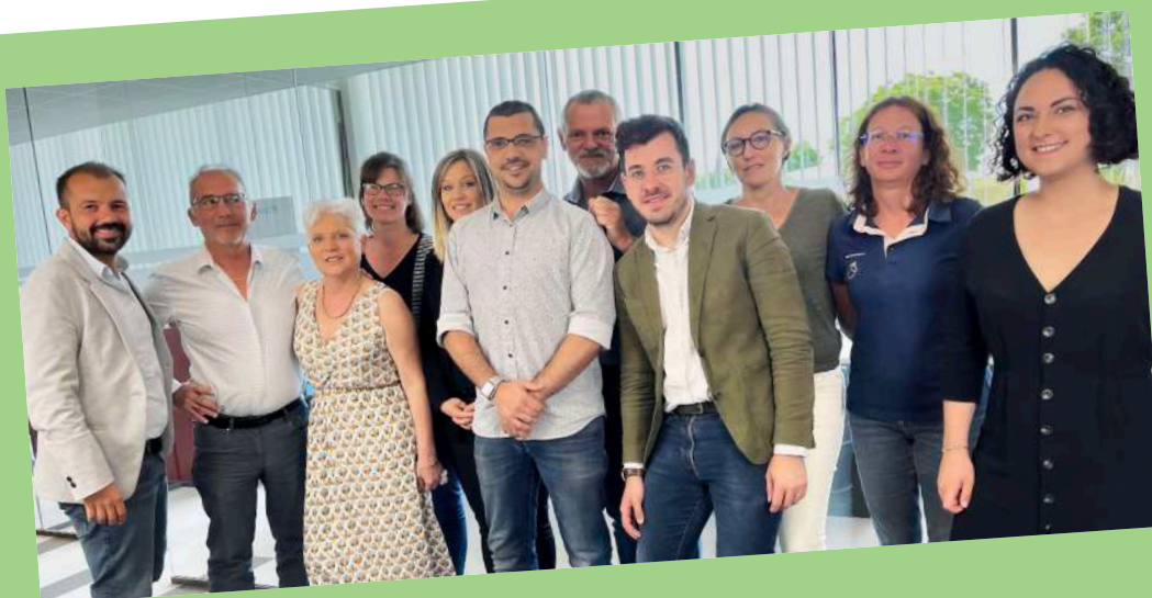
TEAM RP FRANCE 2022