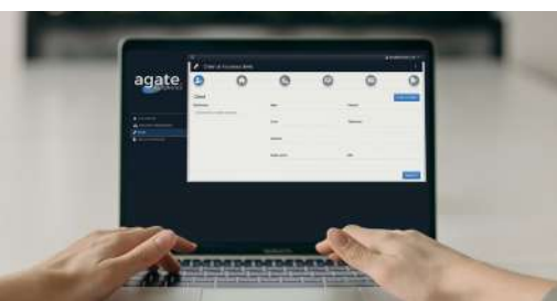
agate Le virage numérique